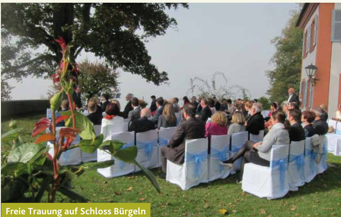
Freie Trauung auf Schloss Bürgeln