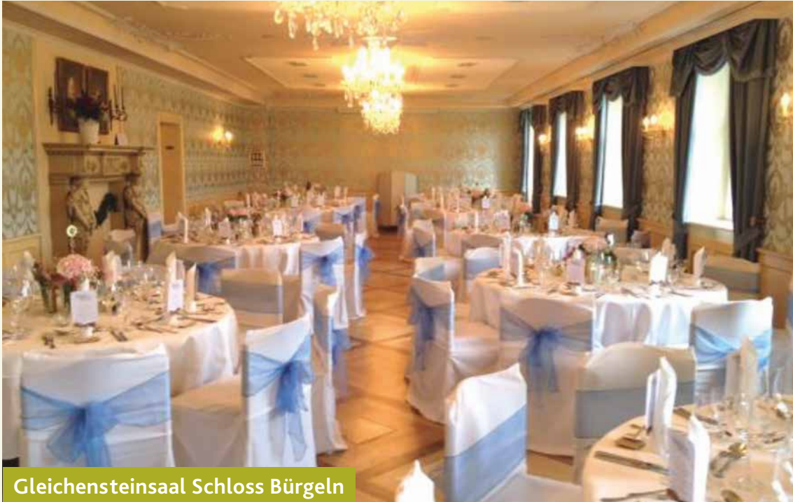
Gleichensteinsaal Schloss Bürgeln

Wir organisieren Ihre Hochzeit auch außerhalb unserer Räumlichkeiten und verwöhnen Sie kulinarisch an diesem besonderen Tag.